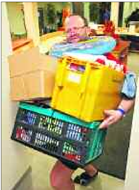
Von wegen am Beckenrand stehen und hübschen Mädchen nachsehen.